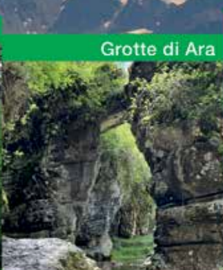
Grotte di Ara