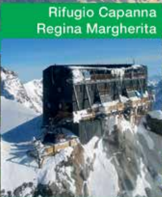
Rifugio Capanna Regina Margherita